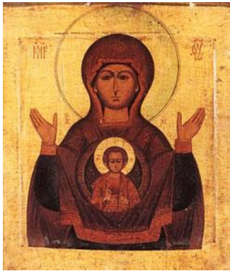
Figura 1 - Ícone do Sinal